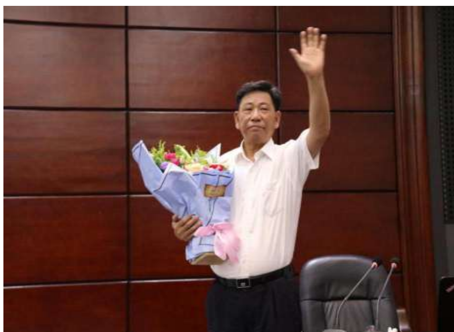
报告会在热烈的掌声中圆满结束

新一代信息技术平台的迅速发展，互联网及其应用的发展，以及不断形成的大数据也成为重要的人造资源。我们也应融入互联网与大数据资源的制造业发展。制造大数据对企业内部管理结构和汽车生产等方面都有重大的影响。最后，杨院士提出有关智能互联网时代制造工程管理的科学问题。