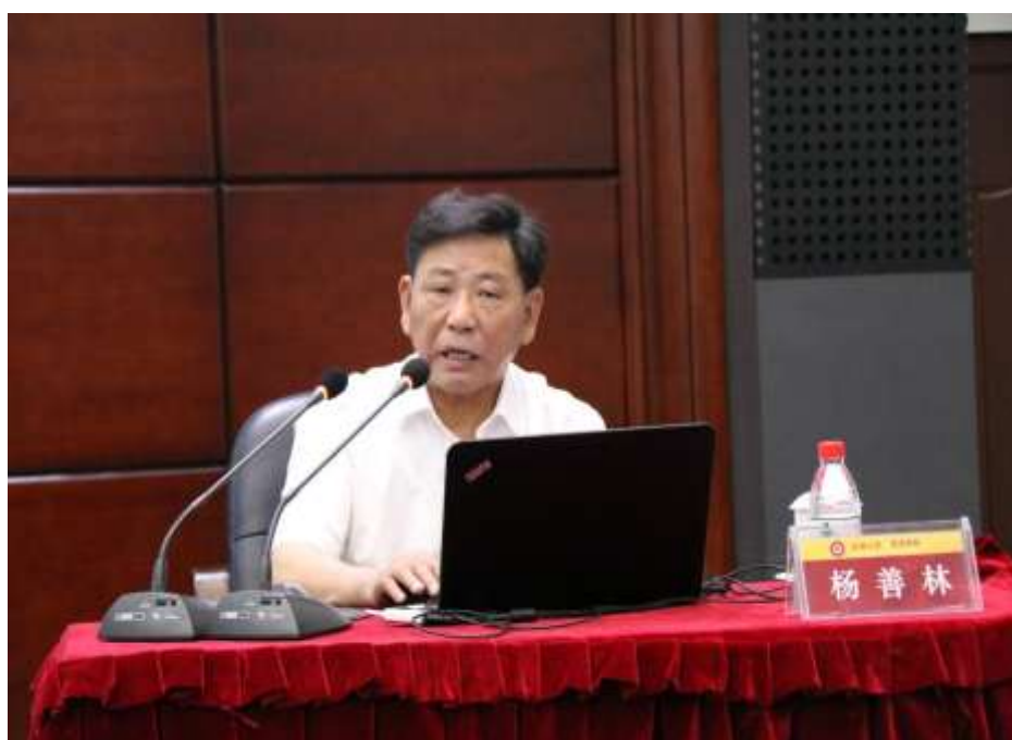
在讲学的杨善林院士

新一代信息技术平台的迅速发展，互联网及其应用的发展，以及不断形成的大数据也成为重要的人造资源。我们也应融入互联网与大数据资源的制造业发展。制造大数据对企业内部管理结构和汽车生产等方面都有重大的影响。最后，杨院士提出有关智能互联网时代制造工程管理的科学问题。